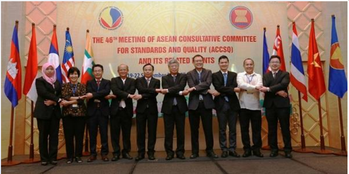
Cuộc họp ACCSQ 46 được tổ chức thành công tại Nha Trang